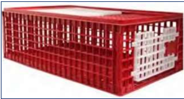
Σχήμα 2.3 Χρήση στιβαρών, ασφαλών και καθαρών κιβωτίων