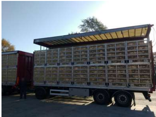
Σχήμα 2.4 Τα φορτηγά μπορεί να έχουν οροφή που μπορεί να ανυψωθεί ώστε να αποφευχθεί η καταπόνηση λόγω ζέστης.