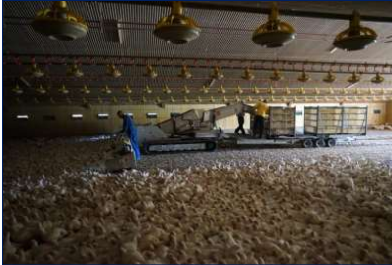
Σχήμα 3.4 Και κατά τη διάρκεια της μηχανικής σύλληψης, πάντα να ελέγχεται η καταλληλότητα των πτηνών.