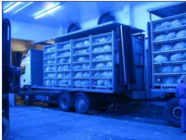
Rysunek 5.1. Dobrze zaprojektowane udogodnienia chroniące strefę rozładunku/załadunku

Lepsze praktyki dotyczące konstrukcji strefy rozładunku