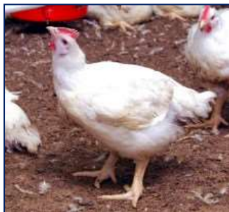
Rysunek 2.5. Woda powinna być dostępna do rozpoczęcia procedury wylapywania