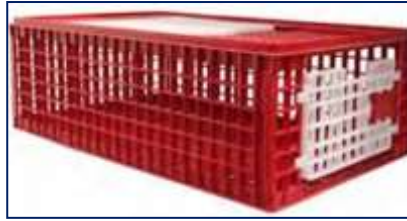
Rysunek 2.3. Przykład solidnego, bezpiecznego i czystego kontenera