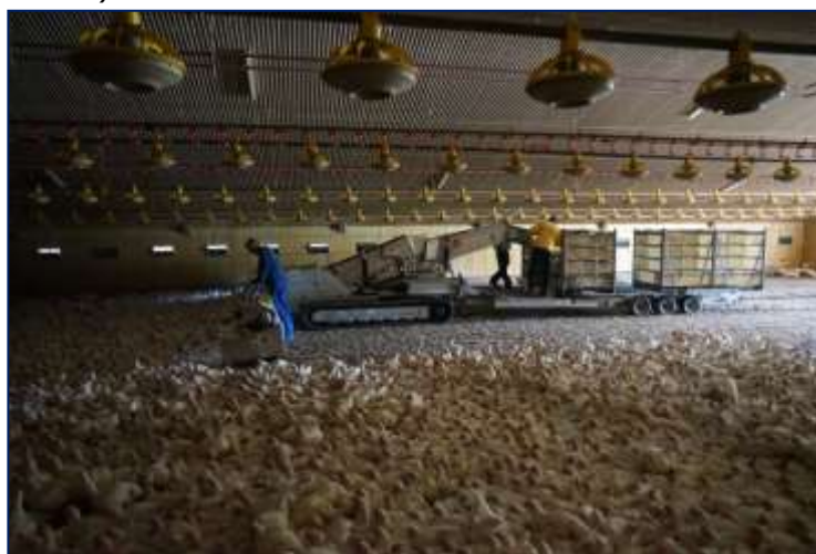
Rysunek 3.4. Nawet podczas mechanicznego wyłapywania cały czas sprawdzaj zdolność ptaków