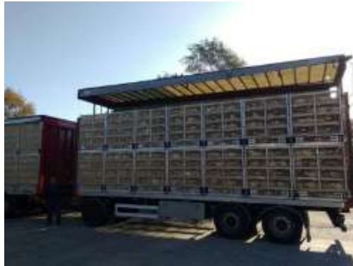
Rysunek 2.4. Pojazd wyposażony w podnoszony dach zapobiegający stresowi cieplnemu u drobiu