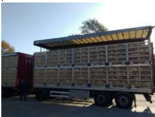
Figura 2.3 Camioanele pot avea acoperișuri care se pot ridica pentru a preveni stresul de căldură.