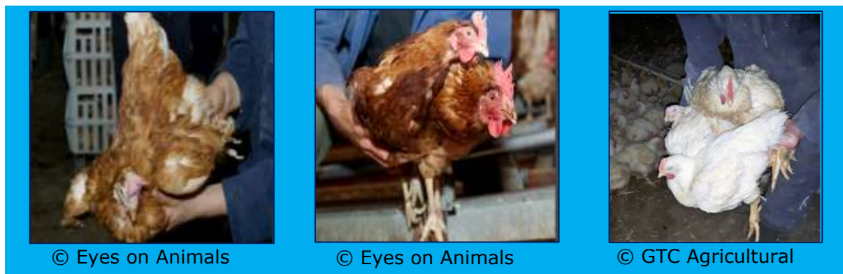
Figura 3.2 Ilustrarea prin fotografii a Bunelor practici mai presus de legislația UE pentru manipularea animalelor în timpul încărcării

Intrarea bruscă a mai multor persoane într-un adăpost de pui provoacă inevitabil stres și comportament de zbor. Cu cât oamenii fac mai puțin zgomot, cu atât mai puțin nervoase vor fi păsările. Tehnica corectă de capturare și transport este importantă . Figura 3.2 ilustrează practici mai bune de capturare pentru găinile la sfârșitul perioade de ouat și pentru puii de carne.