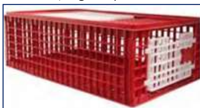
Figura 2.2 Folosirea de containere solide, sigure și curate