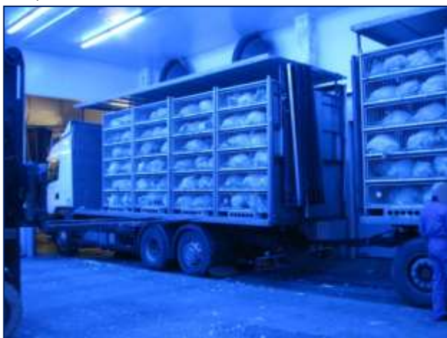
Figura 5.1 Facilitățile bine proiectate care protejează zonele de încărcare/descărcare trebuie utilizate.

Practici mai bune privind designul zonei de descărcare