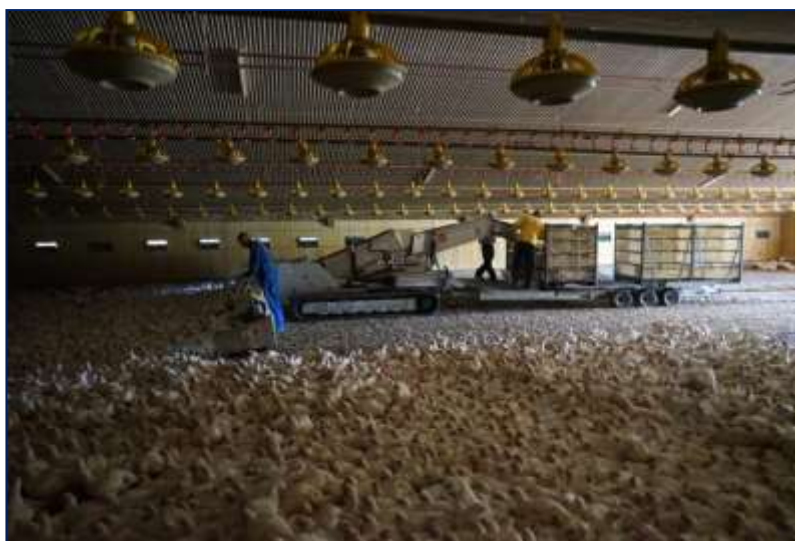
Figura 3.4 Chiar și în timpul prinderii mecanice, întotdeauna verifică continuu capacitatea de transport a păsărilor.