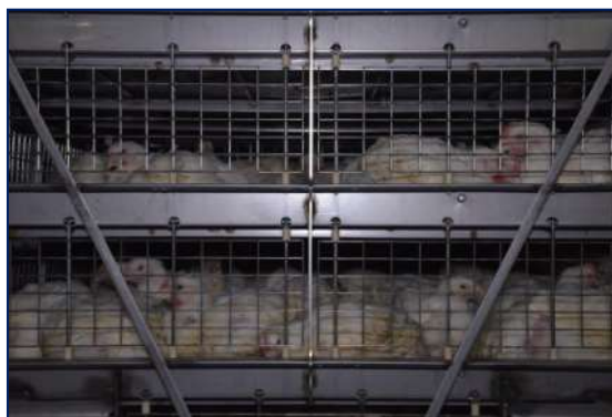
Figura 4.1 Transportul implică mai mulți stresori potențiali, cum ar fi mediul nou și nefamiliar.

Transportul implică mai mulți potențiali factori de stres care ar putea afecta negativ bunăstarea animalelor. Mediul nou și nefamiliar, restricțiile de circulație datorate legării, vibrațiile, zgomotele bruște și neobișnuite, amestecarea cu alte animale, variațiile de temperatură și umiditate, împreună cu ventilația necorespunzătoare și, adesea, restricțiile privind hrana și apa , toate au un impact asupra stării animalelor. Impactul tuturor acestor factori asupra păsărilor este influențat de experiența păsărilor privind transportul, de starea lor fizică și de natura și durata călătoriei. Cu cât călătoria este mai lungă , cu atât este mai probabil ca factorii de stres să aibă consecințe negative asupra bunăstării . În plus, acestea sunt mai susceptibile de a afecta sănătatea animalelor, de ex. datorită susceptibilității crescute a animalelor la boli prin suprimarea imunității și nivelurile ridicate ale cortizolului. În cele din urmă, stresorii prelungiți ridică, de asemenea, preocupări economice legate de pierderile în greutate, DOA (Mort la Sosire - Dead On Arrival) și calitatea redusă a cărnii (vânătăi, carne PSE-Pale Soft Exudative și DFD - Dark Firm Dry meat).