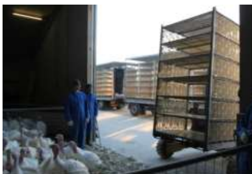
Figura 3.1 Este necesară o echipă de capturare bine instruită pentru a obține cele mai bune rezultate.