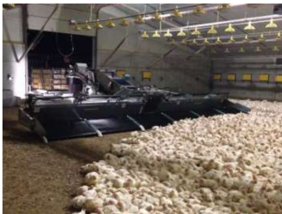
Figura 3.3 În caz de prindere mecanică, verifică mașinile în mod corect.